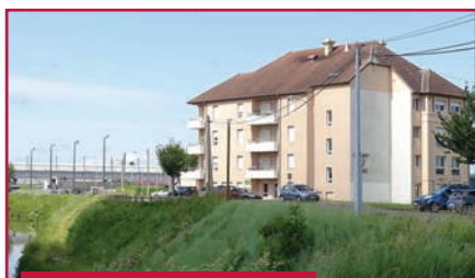
Résidence Les Peupliers

Envisager l'entrée dans une résidence autonomie est un pas, certes difficile, mais cela permet de se libérer des contraintes matérielles (courses, repas...), de se sentir en sécurité et de maintenir les stimulations sociales.