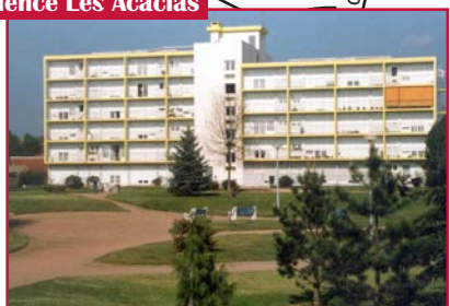
Résidence Les Acacias